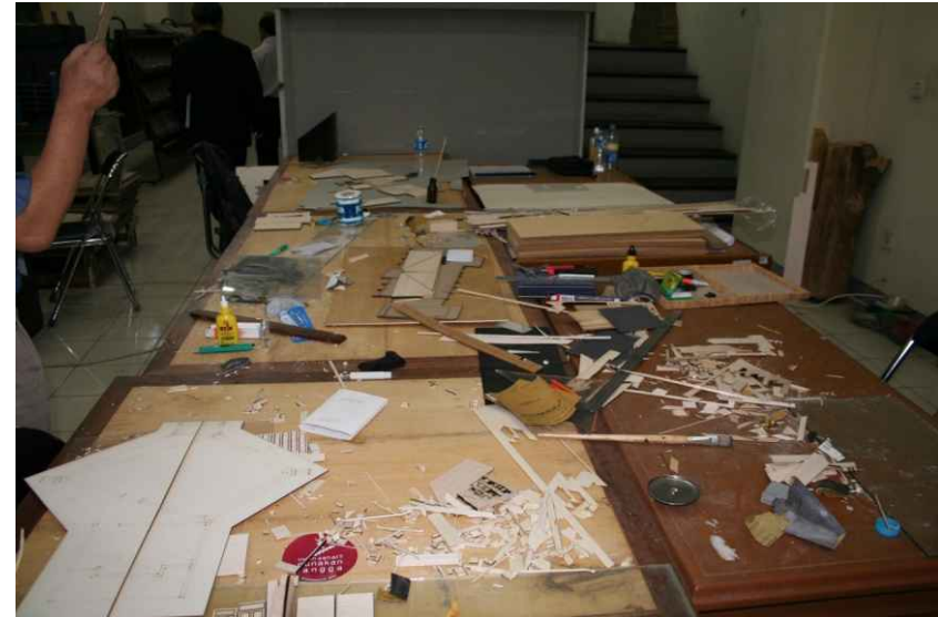
물리적 자원 - 모형제작실