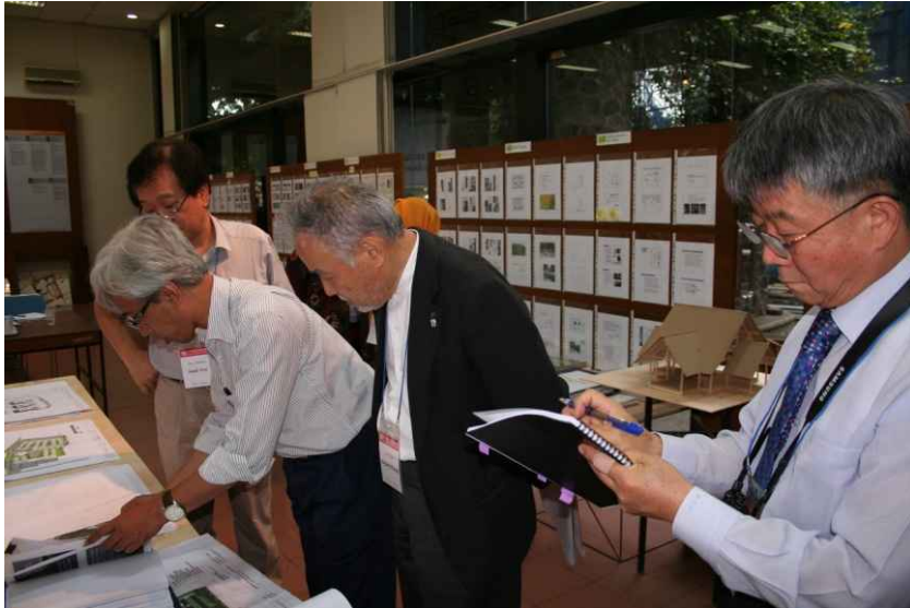
학생성과물 최종 검토