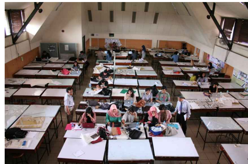
설계수업 참관 - 학부과정