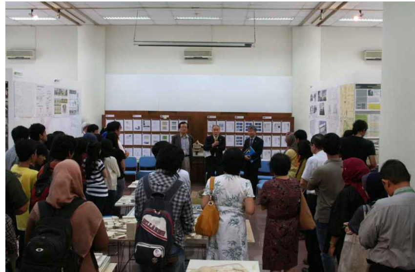
프로그램 구성원 전체와의 마감회의