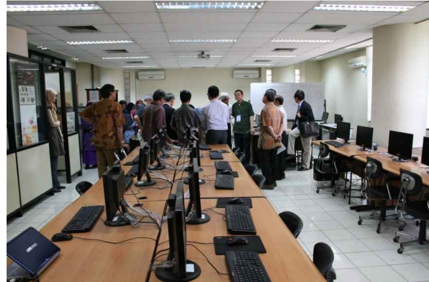
물리적 자원 - 컴퓨터실