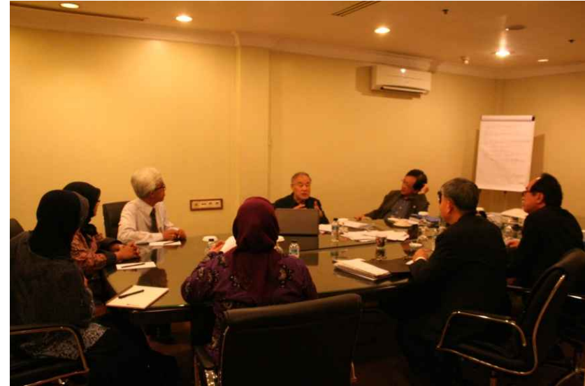
Local Facilitator 및 참관인 오리엔테이션