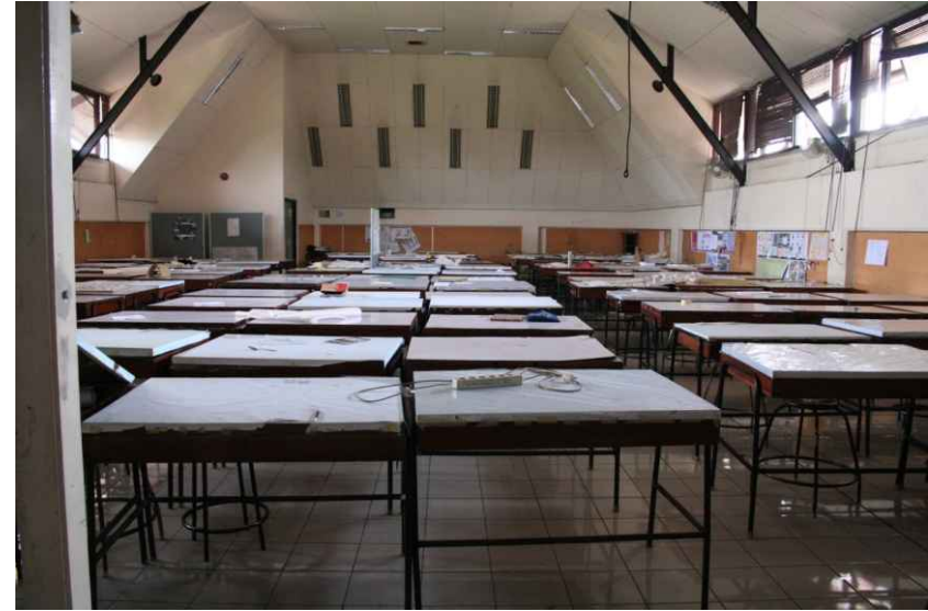
물리적 자원 - 설계 스튜디오(학부)