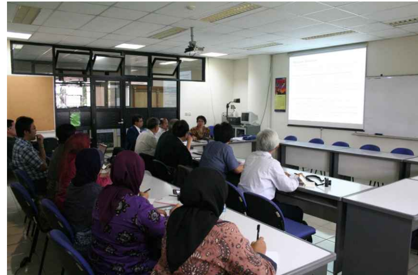
프로그램 소개 프레젠테이션