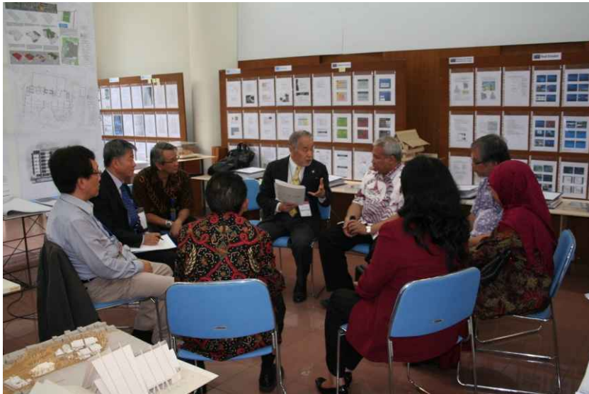
대학 행정책임자와의 마감회의