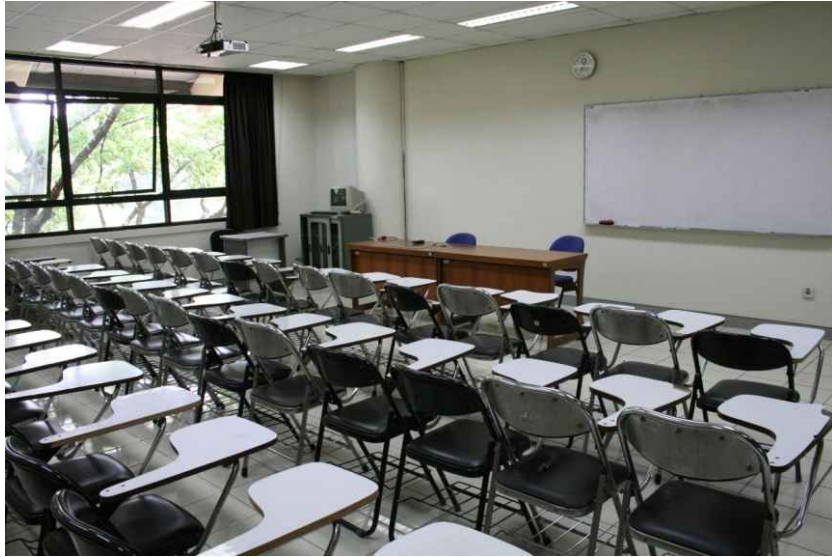
물리적 자원 - 강의실