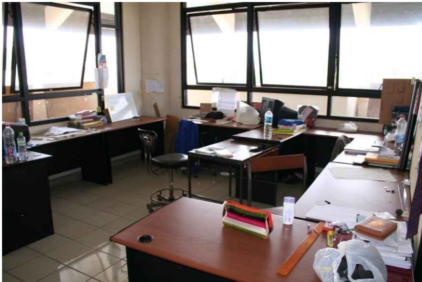
물리적 자원 - 설계 스튜디오(학부)