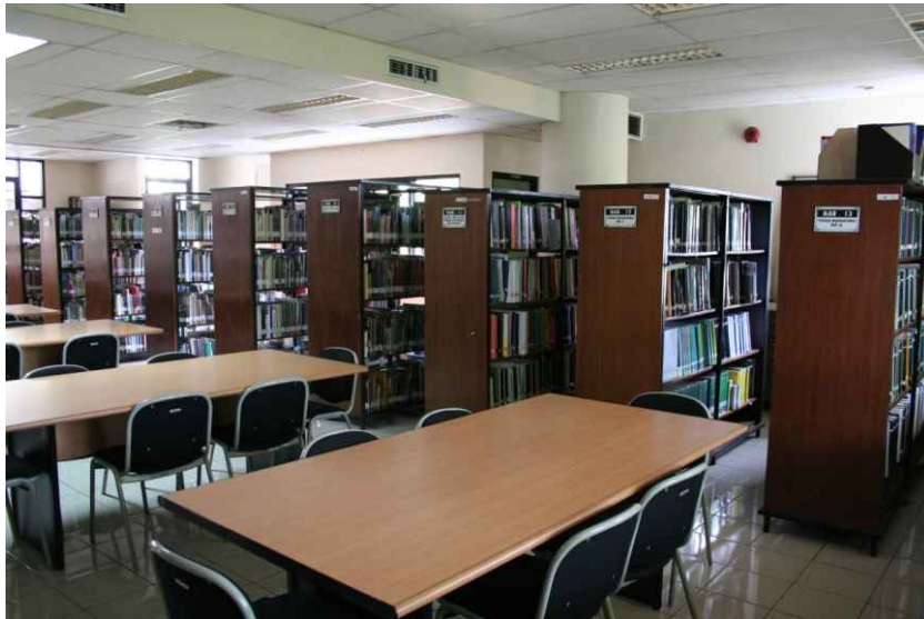
물리적 자원 - 건축대학 도서관