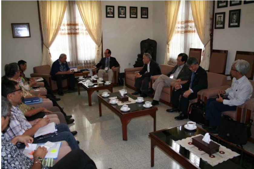
대학 총장과의 실사시작 회의