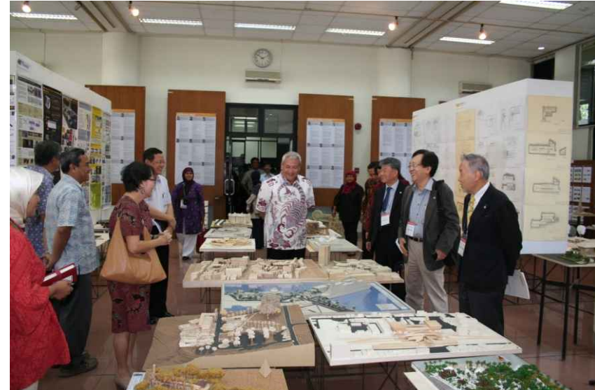
대학 총장의 실사전시장 방문