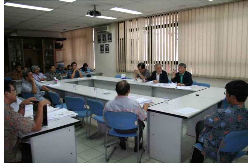
프로그램 교수진과의 질의 응답