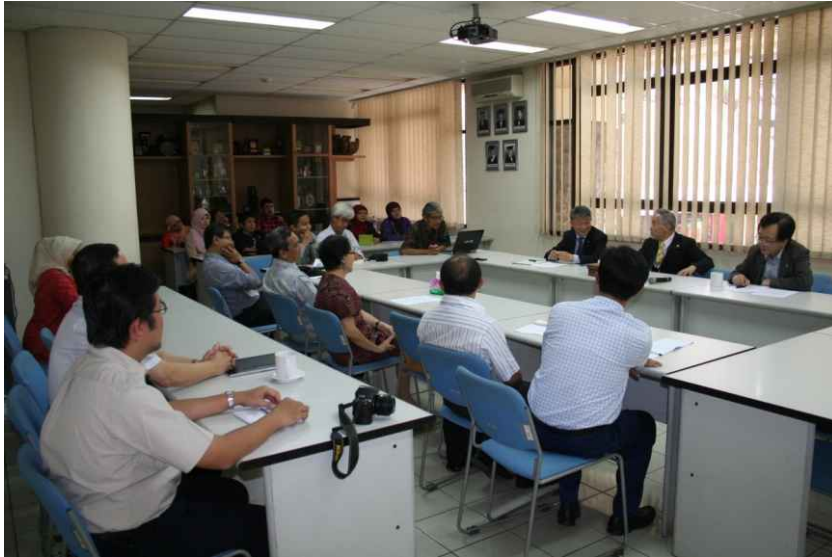
프로그램 교수진과의 마감회의