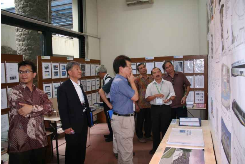
학생성과물 전시개요 설명