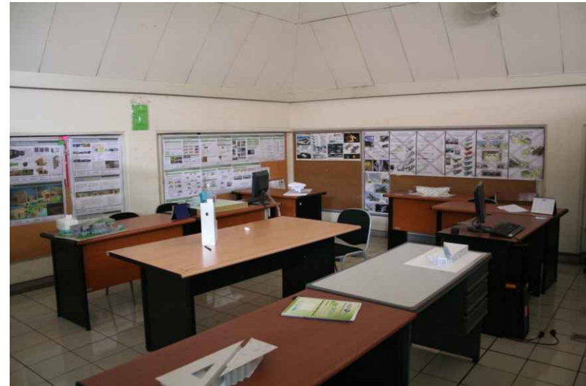
물리적 자원 - 설계 스튜디오(대학원)